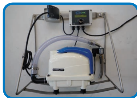
VITALIS Premium eco Wandkonsole