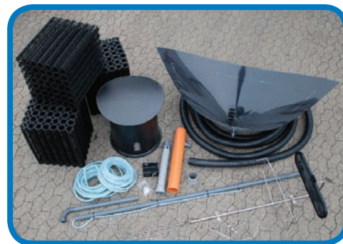
VITALIS Premium pro Rüstsatz

Das VITALIS Festbett-Verfahren ist auch als reiner Rüstsatz für 3-Kammer-Betonbehälter erhältlich, anpassbar für Durchmesser bis 2,5 m bzw. Wassertiefen bis 2 m.